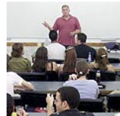
"הבחינה צפויה להתארך" (ארכיון)